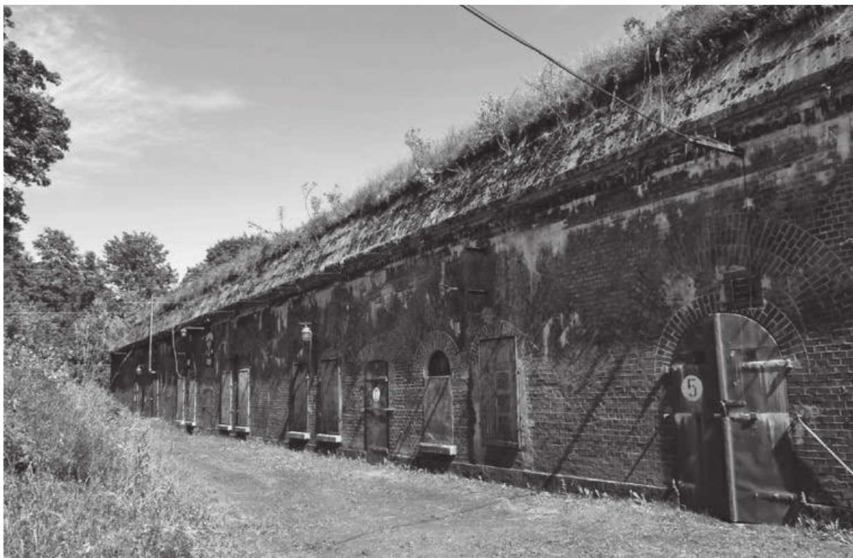
Ryc. 16.1. Fort XIV – blok koszarowy

Właścicielem fortu jest bydgoski Hotel City. Obiekt jest bez przerwy nadzorowany, chętnie udostępniany do zwiedzania i organizowania różnych imprez kulturalnych, edukacyjnych i szkoleniowych.