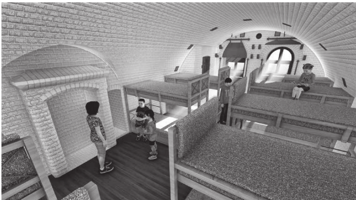
Ryc. 16.7. Blok koszarowy – nocowanie w kazamacie

typowo historyczną z pełnym odtworzeniem wyglądu fortu z czasów jego powstania. Na ten cel planowane jest wykorzystanie części bloku koszarowego (kuchni i magazynu kuchni), prochowni w lewym barku oraz poterny i lewego dwukondygnacyjnego schronu remizy artyleryjskiej w wale czołowym, części stoku z zasiekami oraz jednej z wartowni przedpola. Obcowanie z historią możliwe byłoby na dwa sposoby: stały i czynny. Stałe poznawanie historii to zwiedzanie ekspozycji np. o historii Twierdzy Toruń i innych czasowych wystaw związanych z fortecznymi tematami zlokalizowanych w kazamatach. Czynne poznawanie historii związane byłoby z uczestnictwem w wytaczaniu działa z remizy na wał, w wykonywaniu czynności, by oddać strzał.