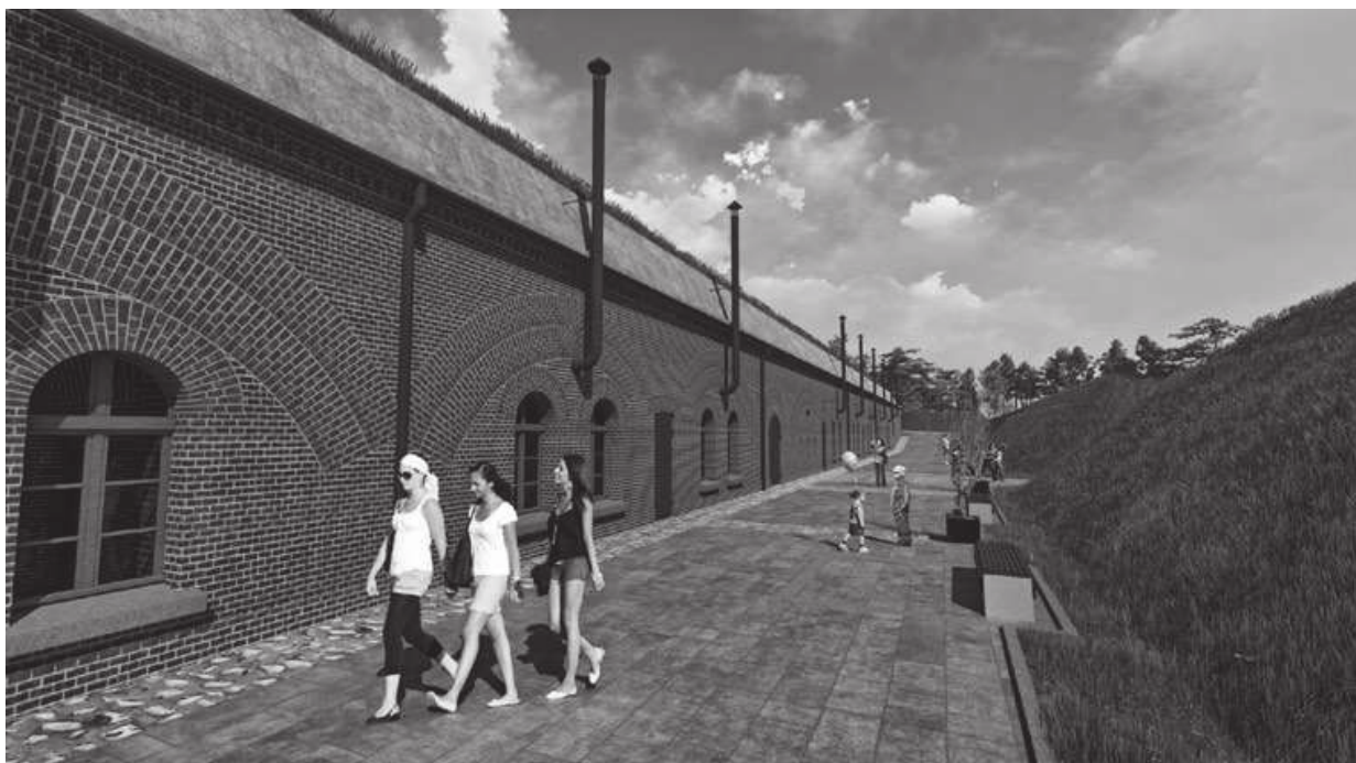
Ryc. 16.5. Blok koszarowy – projekt