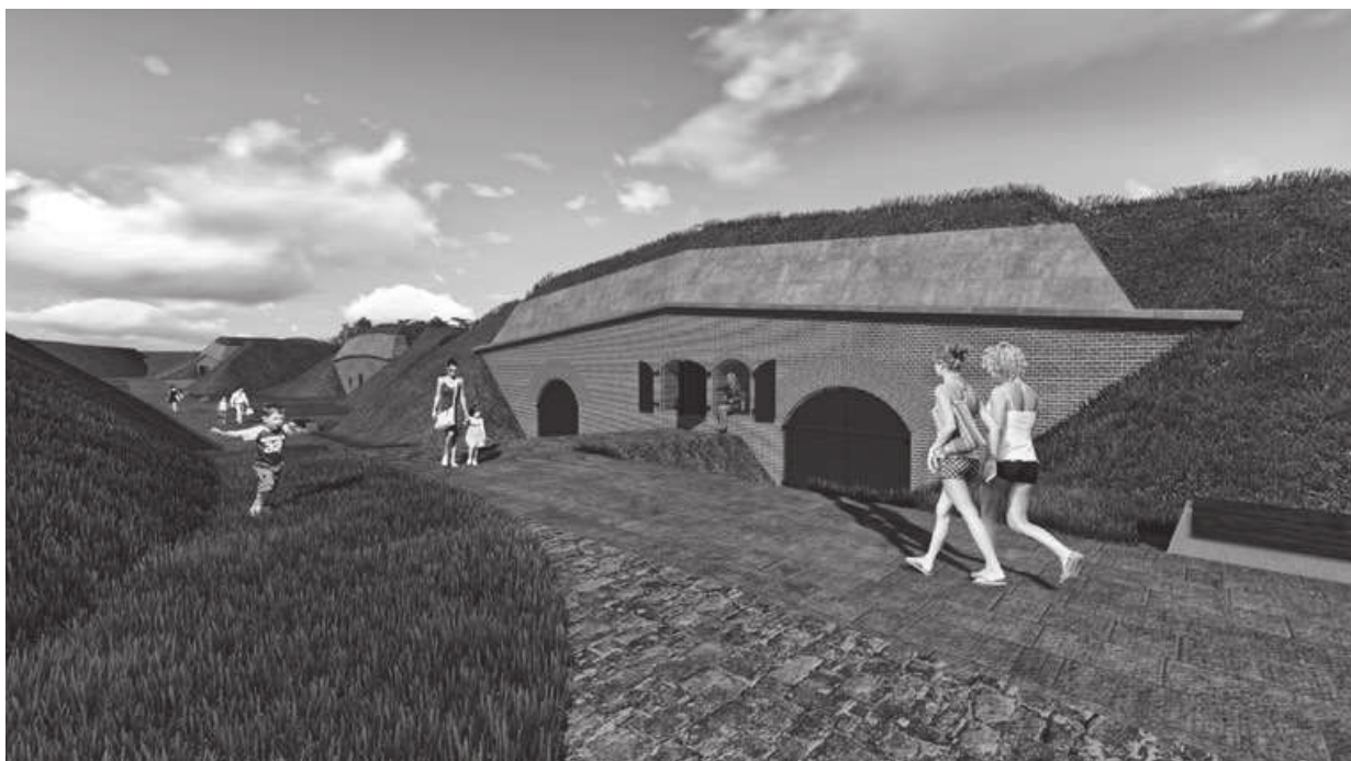
Ryc. 16.6. Schrony w wale czołowym – projekt

panoramicznym na cały teren fortu. W sąsiedztwie budynku przewidziano także miejsce dla pola namiotowego z pełnym węzłem sanitarnym. Bryła budynku nawiązuje kształtem do bastionu, przykryta jest dachem zielonym, ściany przysypane są wałami ziemnymi. Powyższe rozwiązania oraz lokalizacja na gęsto zalesionym terenie sprzyja ukryciu budynku i minimalizowaniu jego dominacji w przestrzeni. Parter budynku jest obniżony w terenie, przez co dojście w formie łamanej transzei potęguje forteczny charakter budynku.